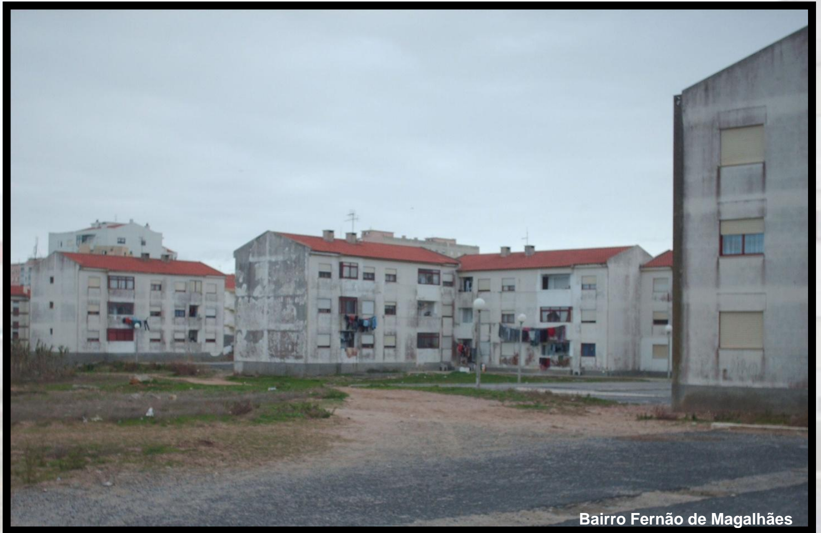
Bairro Fernão de Magalhães