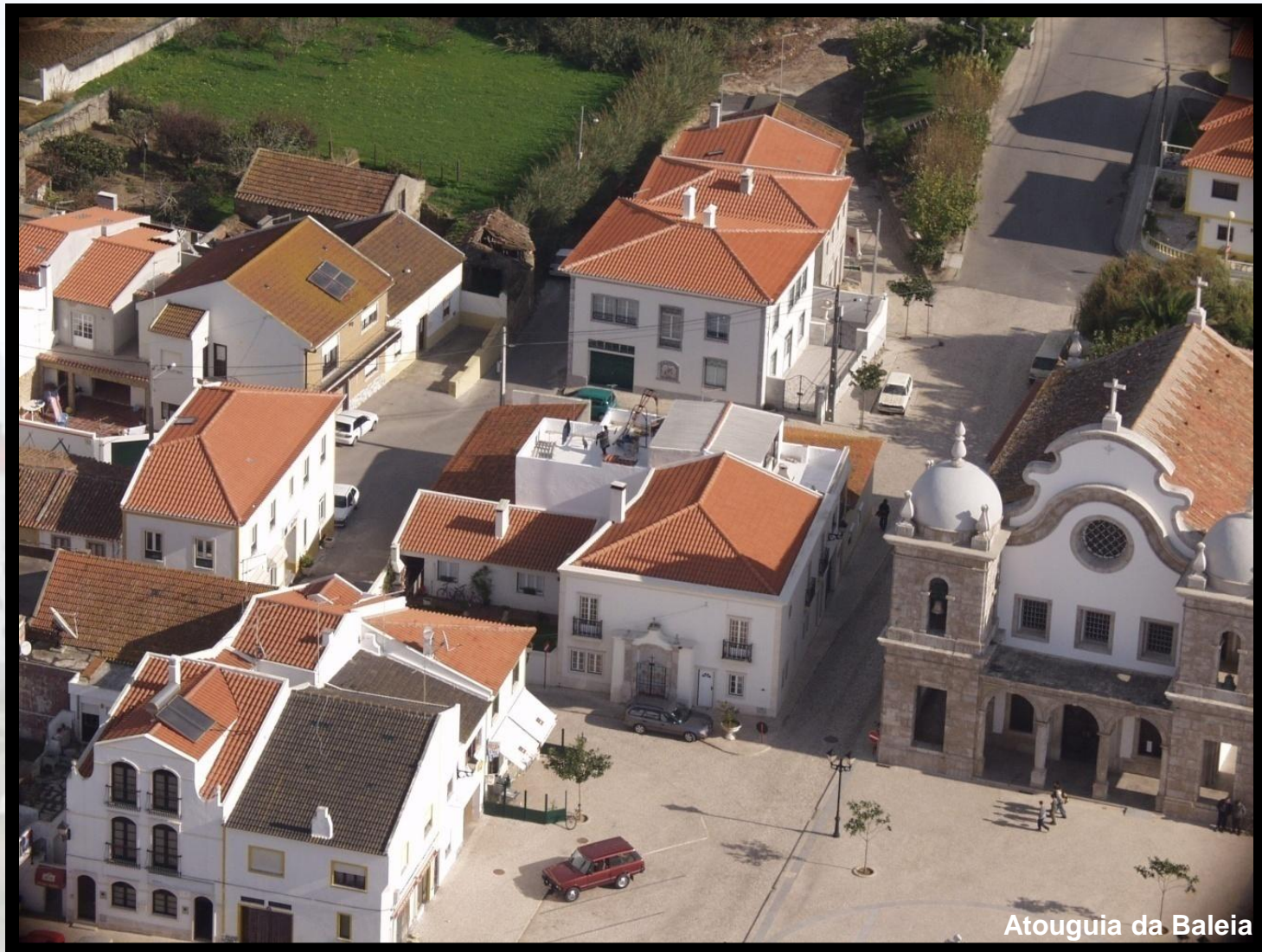
Atouguia da Baleia